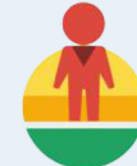
Street View API