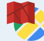
Static Maps API