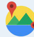
Distance Matrix API