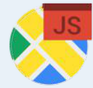
Maps JavaScript API