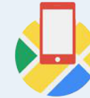
Maps SDK für iOS